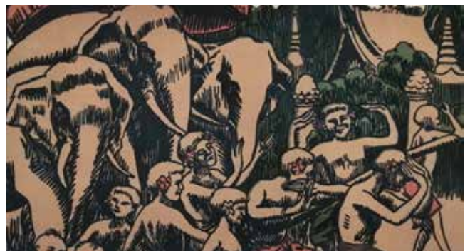
Gravure «Chersonèse d'Or» (1925) Librairie Michael Seksik