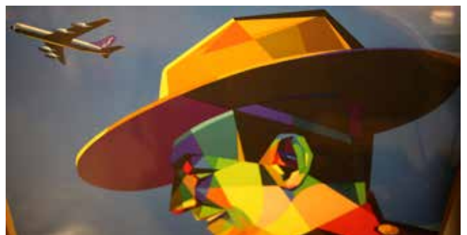
Affiche Sabena (1950) Librairie Jean-Pierre Decnop