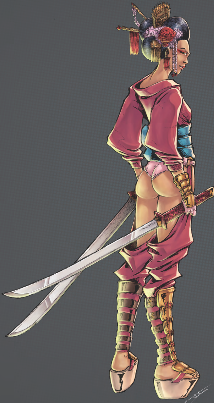
SALON BiblioMania Dessin de Thibault Colon de Franciosi Agnès & Claude Tilly STAND 109